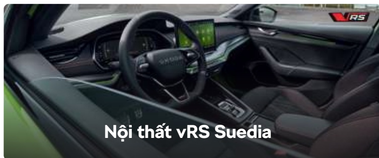
Nội thất vRS Suedia