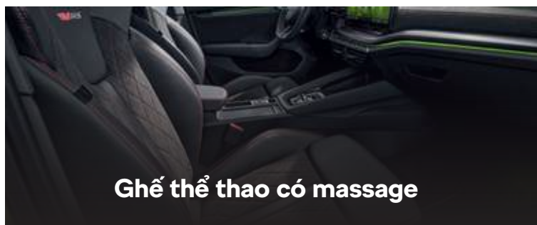
Ghế thể thao có massage