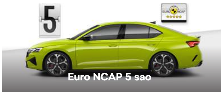
Euro NCAP 5 sao