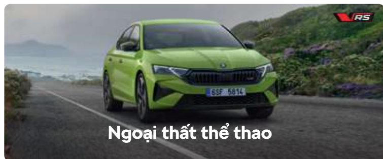
Ngoại thất thể thao