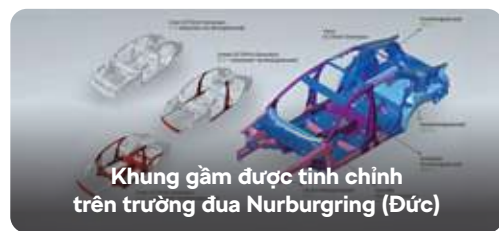
Khung gầm được tinh chỉnh trên trường đua Nurburgring (Đức)