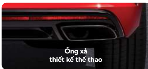
Ống xả thiết kế thể thao