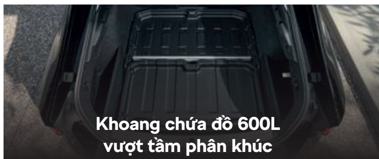
Khoang chứa đồ 600L vượt tầm phân khúc