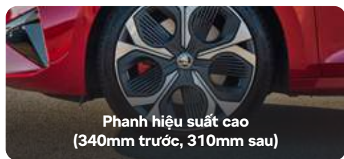
Phanh hiệu suất cao (340mm trước, 310mm sau)